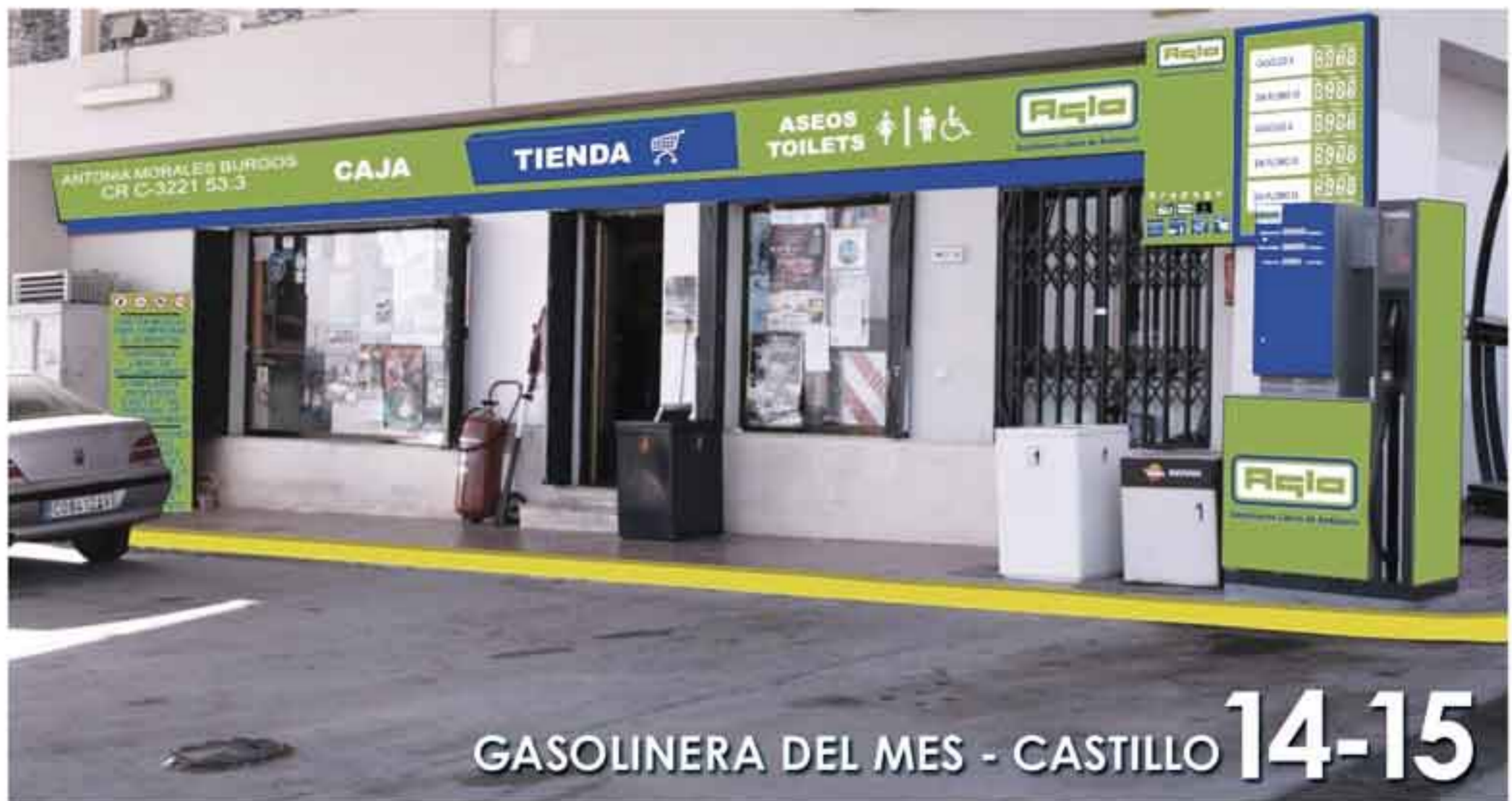
GASOLINERA DEL MES - CASTILLO 14-15