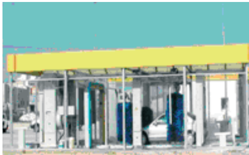
Túnel de lavado