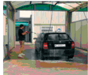
Box de lavado