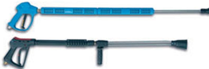
Pistola de agua a presión

El número de coches/hora que lava un tren es muy variable según el modelo de máquina, pudiendo ir desde 20 coches hora hasta 100 coches hora. El consumo de agua también es muy variable debido a la gran variabilidad de configuraciones que pueden darse (más o menos módulos de cepillos, altas presiones, lavados de bajos).