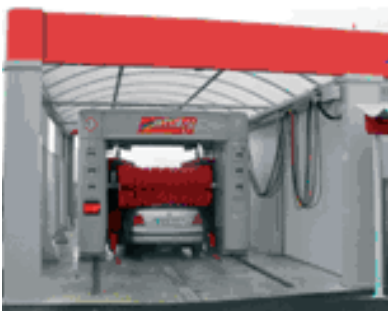
Puente de lavado